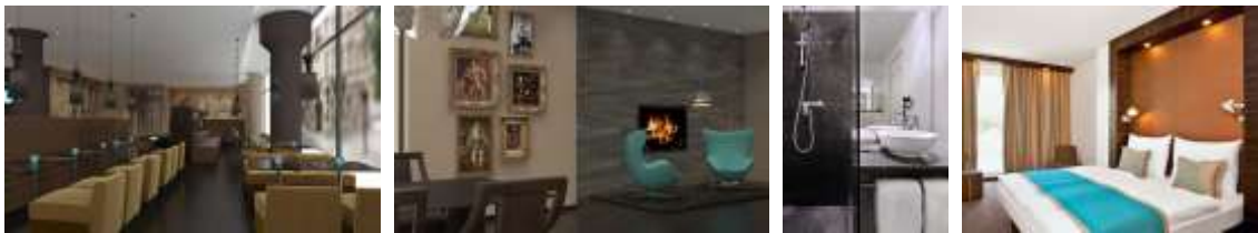
3* Hotel London

7. Dezember : Eigene Anreise nach London Heathrow oder Gatwick ( weitere Airports auf Anfrage ). Nach Ihrer Ankunft werden Sie bereits von Ihrem deutschsprachigen Tourguide empfangen. Starten Sie Ihre London Reise mit einer Stadtrundfahrt. Danach geht es zu ihrem Hotel in der City von London. Von hier aus lassen sich die Sehenswürdigkeiten ideal erreichen.